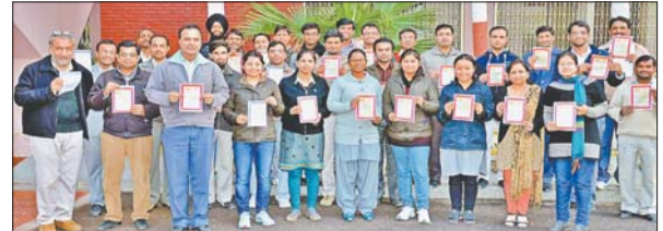
भेल में बेटी ही बचाएगी अभियान में शामिल होते कर्मचारी।