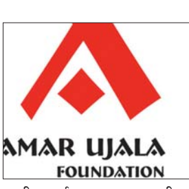
AMAR UJALA FOUNDATION