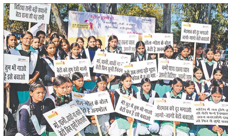
अमर उजाला के 'बेटी ही बचाएगी' अभियान के समापन पर देहरादून के परेड ग्राउंड से निकाली गई जागरूकता रैली में जीजीआईसी राजपुर रोड की छात्राएं विभिन्न स्लोगन बोर्ड के साथ।

पेंटिंग प्रतियोगिता होगी, जिसमें आठवीं कक्षा तक के छात्र हिस्सा लेंगे। विधान सभा में समाज कल्याण विभाग, शिक्षा विभाग, श्रम विभाग, गृह विभाग एवं आपदा विभाग से संबंधित पांच प्रस्ताव पास किये जाएंगे। इन विभागों के मंत्री भी बनाए जाएंगे, जबकि मुख्यमंत्री, नेता प्रतिपक्ष और स्पीकर भी इन बाल प्रतिनिधियों में से चुने जाएंगे।