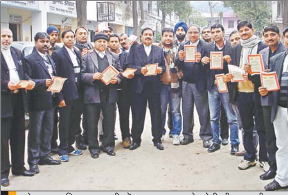
रोशनाबाद स्थित कचहरी में अमर उजाला के बेटी ही बचाएगी अभियान में शामिल होते अधिवक्ता।

डॉक्टर, अधिकारी, शिक्षक, छात्र और कर्मी अमर उजाला की मुहिम में हुए शामिल