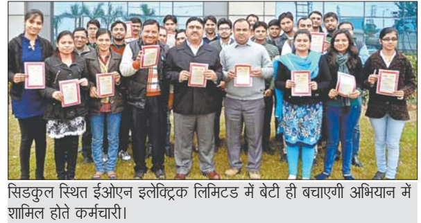
सिडकुल स्थित ईओएन इलेक्ट्रिक लिमिटेड में बेटी ही बचाएगी अभियान में शामिल होते कर्मचारी।