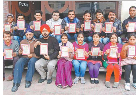
चंद्राचार्य चौक के समीप अभियान में शामिल मूक-बधिर।