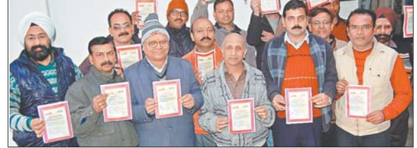
चंद्राचार्य चौक के समीप अभियान में शामिल होते व्यापारी।