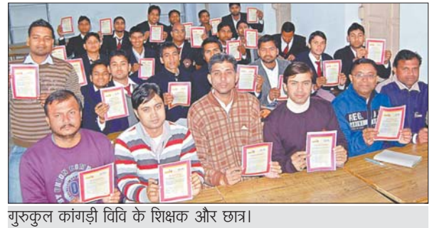
गुरुकुल कांगड़ी विवि के शिक्षक और छात्र।