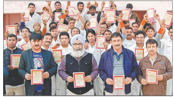
रोशनाबाद स्थित स्टेडियम में अभियान में शामिल किरखी के अधिकारी व कर्मी।