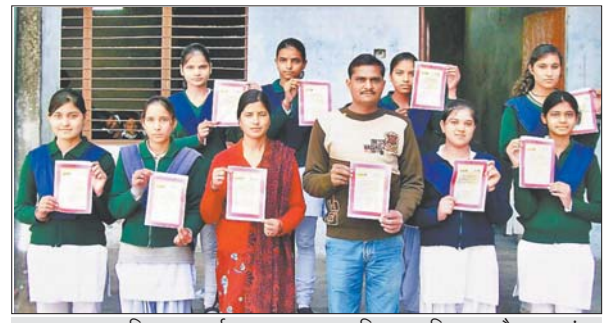
बहादुरपुर जट स्थित आदर्श बाल सदन उमा विद्यालय शिक्षक और छात्राएं।