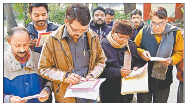
नगर निगम में अभियान के दौरान शपथ-पत्र भरते कर्मचारी।