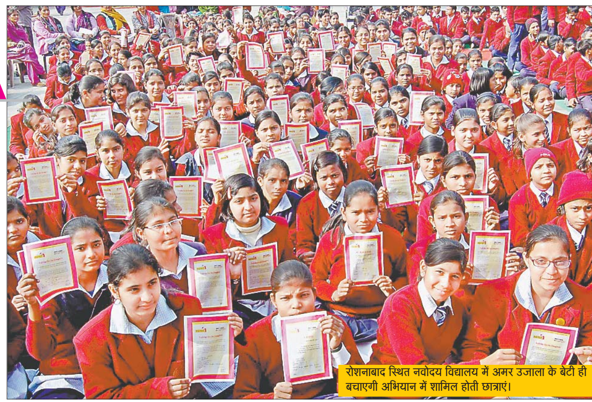
रोशनाबाद स्थित नवोदय विद्यालय में अमर उजाला के बेटी ही बचाएगी अभियान में शामिल होती छात्राएं।

अन्य स्टॉफ ने भी अपना समर्थन देते हुए अमर उजाला के इस अभियान की सराहना की।